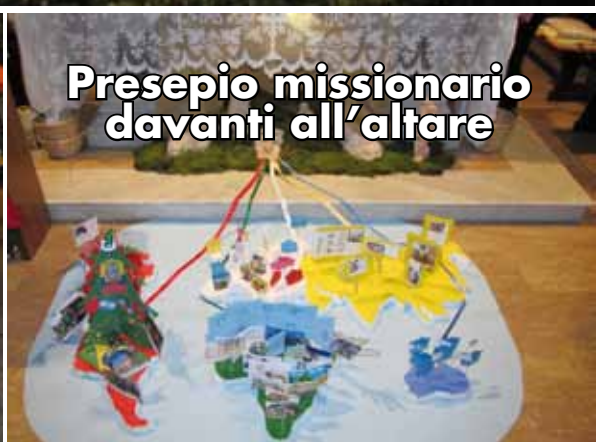
Presepio missionario davanti all'altare