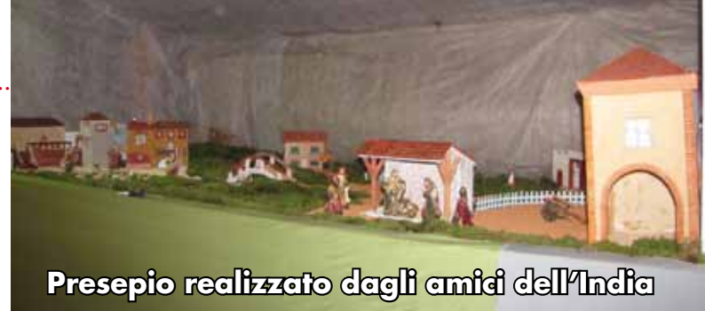
Presepio realizzato dagli amici dell'India