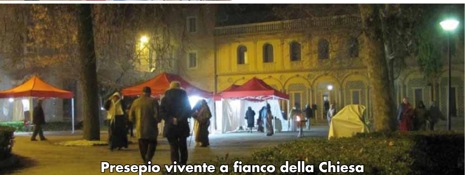
Presepio vivente a fianco della Chiesa