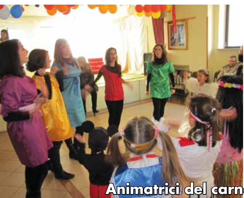
Animatrici del carnevale in Parrocchia