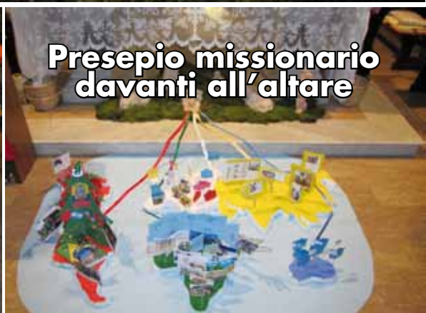
Presepio missionario davanti all'altare