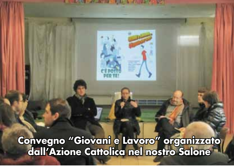
Convegno "Giovani e Lavoro" organizzato dall'Azione Cattolica nel nostro Salone