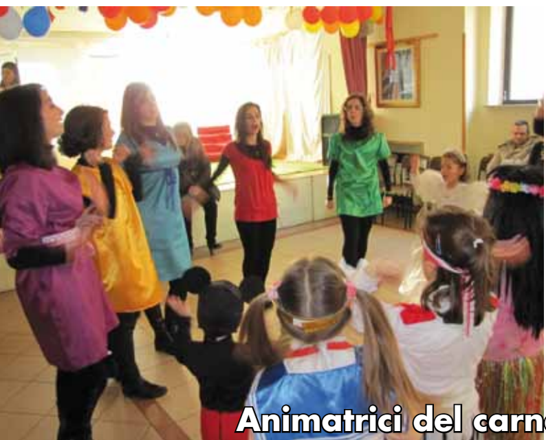
Animatrici del carnevale in Parrocchia